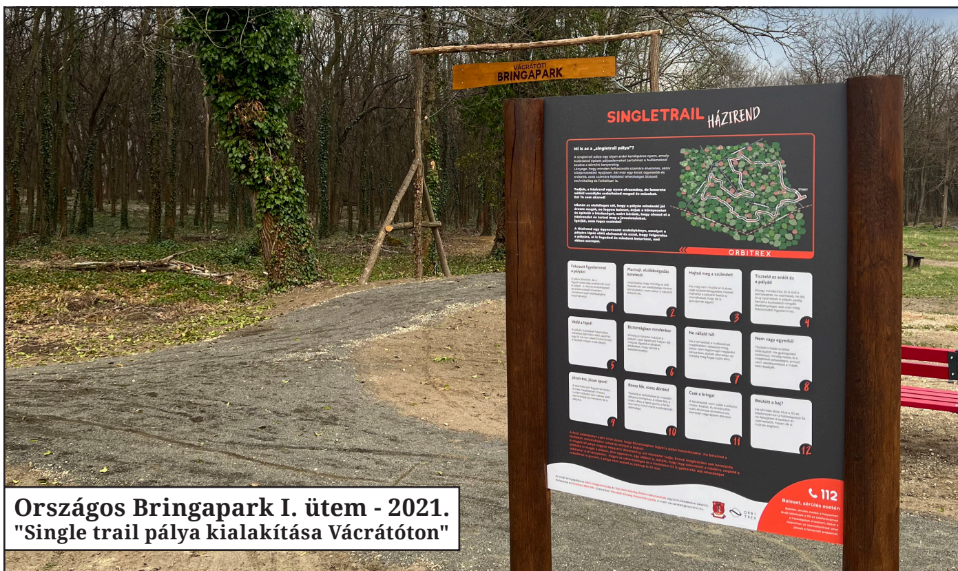
Országos Bringapark I. ütem - 2021. "Single trail pálya kialakítása Vácraátóton"